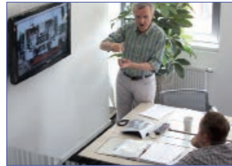
Analyse- und Konzeptionsphase bei tecteam.

bei Bedarf für die Verwendung eines Redaktionssystems modularisiert. Ziel ist eine hohe Qualität der Technischen Dokumentation bei gleichzeitiger Kostensenkung und hoher Transparenz. tecteam entbindet seine Kunden zwar von vielen Aufgaben, koppelt sie aber nicht von den Entscheidungswegen ab.