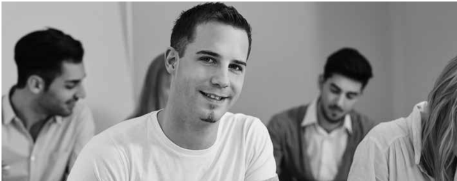
Fit für die Arbeit in der Technischen Dokumentation.